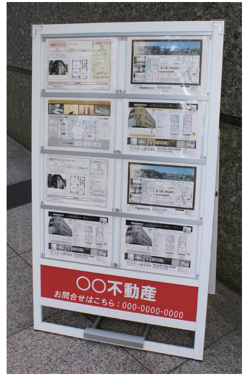
※片面(ホワイト)の掲出イメージ