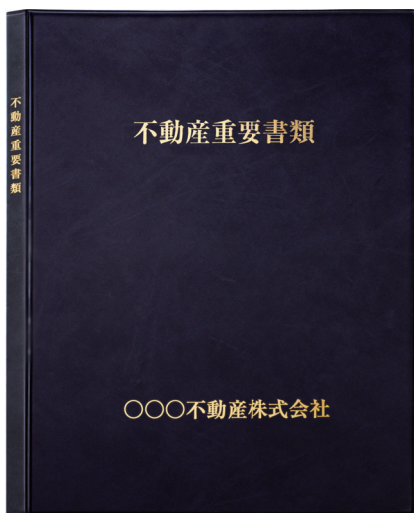
▲名入れタイプ(イメージ)

契約書、重要事項説明書などをまとめて、お客さまにお渡しするのにおすすめのファイルです。 マチ付き内袋が2枚入っているタイプなので、多くの書類を入れることができます。 高級感があるため、貴店のイメージアップに繋がります。貴店の商号が入られる商品です。