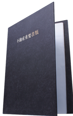
▲名入れなしタイプ(イメージ)